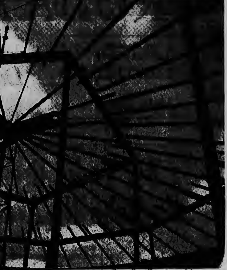
E splinrag aki di berro, berdaderamente ta parse „arte moderno”. Asina aki ta prin- cipiá un dak pa tanki di awa. Nos a saca e portret aki na Balashi na unda nan ta traha duro riba cuater di e tankinan aki pa warda e awa di bebe cu pronto lo worde prpducí.